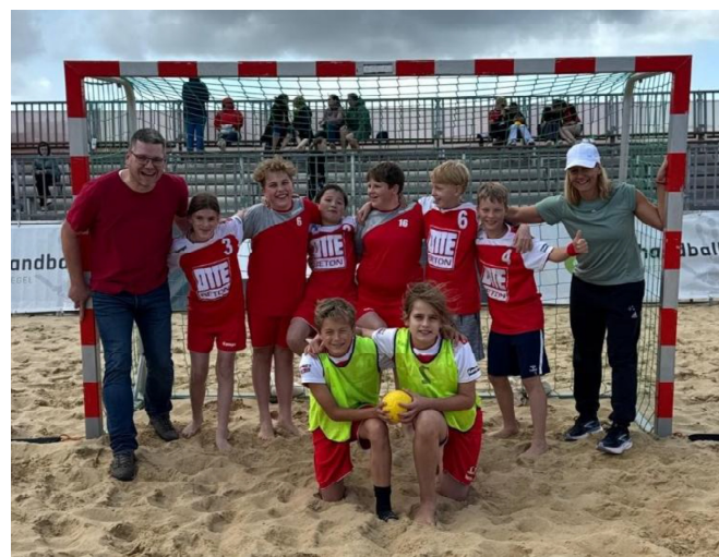
Weibliche/männliche D-Jugend (beim Beachhandballturnier in Cuxhaven)

Zudem spielen wir mit der männlichen B-Jugend in einer Spielgemeinschaft mit dem TUS Augustfehn.